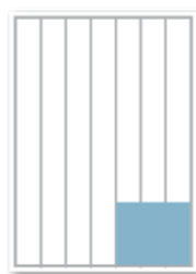
136 x 100 mm