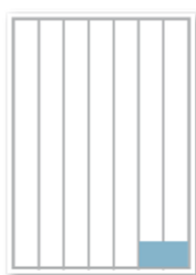
90 x 50 mm