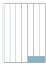
136 x 50 mm